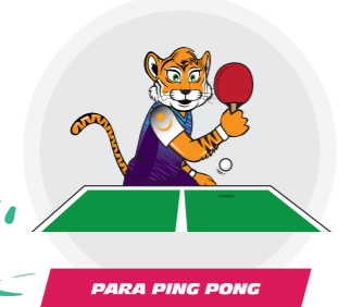
PARA PING PONG