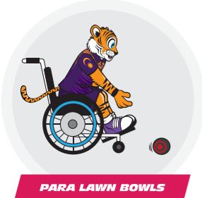
PARA LAWN BOWLS