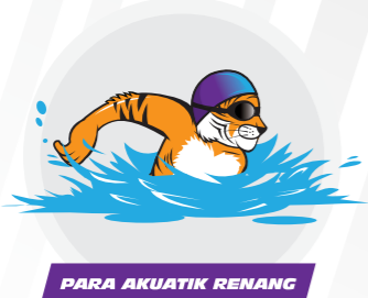
PARA AKUATIK RENANG