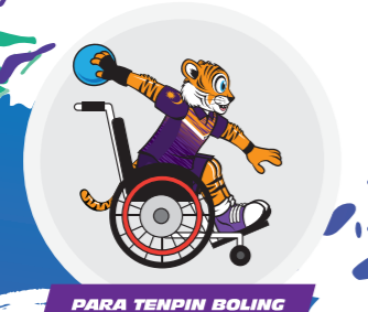
PARA TENPIN BOLING